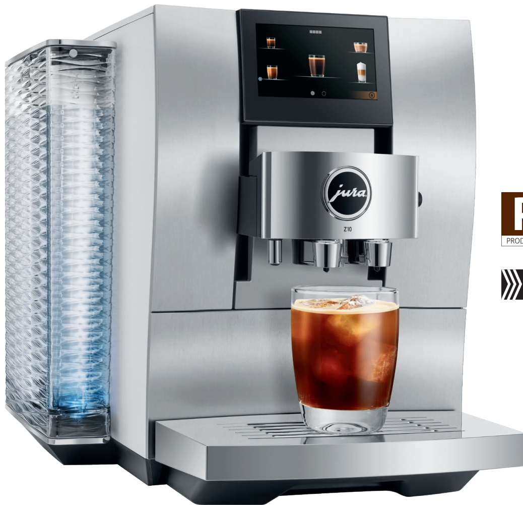
Aluminium White (EA)